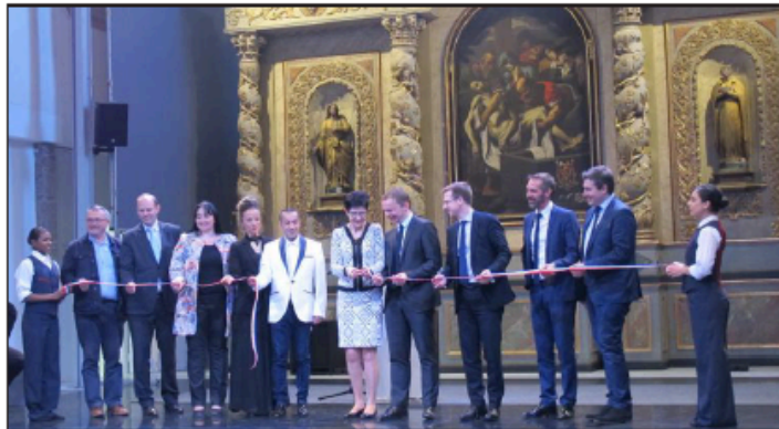
Le couper de ruban, devant le retable et ses fameuses colonnes torsées.