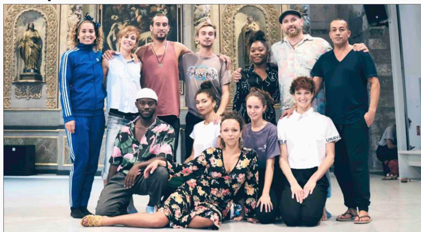
Les danseurs du projet "Premier's Pas" ont mis eux aussi leur travail entre parenthèses.

Pour les danseurs qui vivaient depuis plusieurs mois au rythme du projet "Premier's Pas", le temps s'est figé aussi le 16 mars. Après avoir joué pour la première fois à Annonay le 25 janvier, la création avait pris son envol national et devait encore faire vibrer les spectateurs de Toulon, le 27 mars. Les artistes venaient de passer tout le mois de février à An-